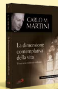
7ª uscita: LA DIMENSIONE CONTEMPLATIVA DELLA VITA di Carlo Maria Martini Con FC n. 14 in uscita il 1/4/2010