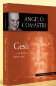
6ª uscita: GESÙ... E SE FOSSE TUTTO VERO? di Angelo Comastri Con FC n. 11 in uscita il 11/3/2010