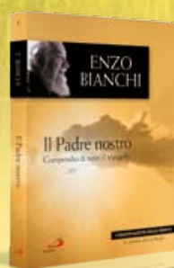
1ª uscita: IL PADRE NOSTRO di Enzo Bianchi Con FC n. 6 in uscita il 4/2/2010

UNA SERIE DI VOLUMI DEDICATA ALLA DIMENSIONE CONTEMPLATIVA DELLA VITA. UN SEMPLICE CAMMINO PERSONALE E FAMILIARE DURANTE IL PERIODO DELLA PREPARAZIONE ALLA PASQUA.