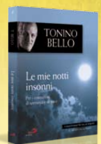
4ª uscita: LE MIE NOTTI INSONNI di Tonino Bello Con FC n. 9 in uscita il 25/2/2010