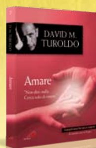
2ª uscita: AMARE di David Maria Turoldo Con FC n. 7 in uscita il 11/2/2010