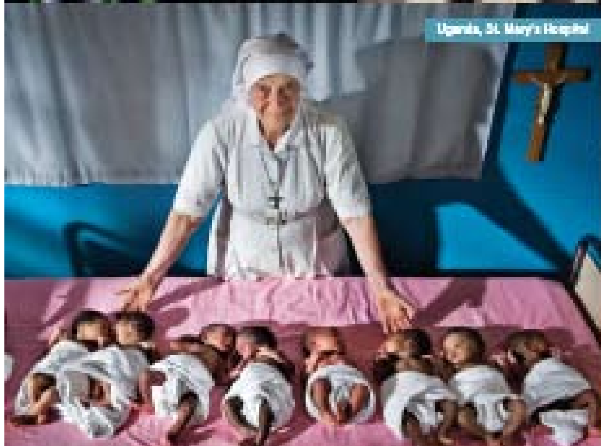
Uganda, St. Mary's Hospital