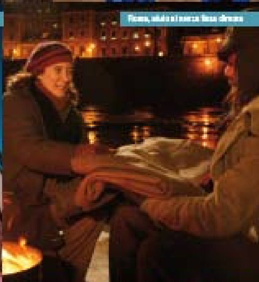
Roma, aiuto ai senza fissa dimora