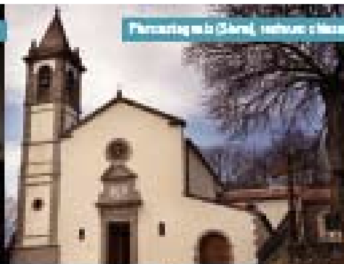
Finlandia, la Chiesa, restano chiuse