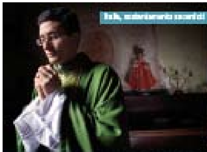
Italia, matrimonio sacerdoti